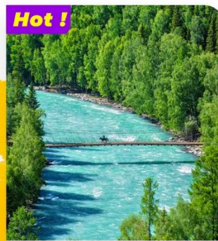
Hot ! Khám phá Hồ Kanas