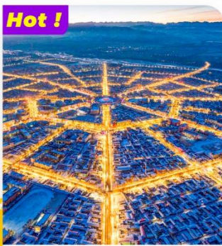
Hot ! Khám phá Thành phố bát quái Tekes