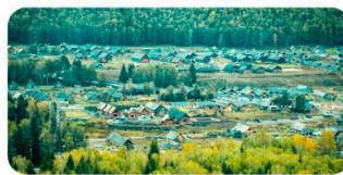
Làng Hòa Mộc