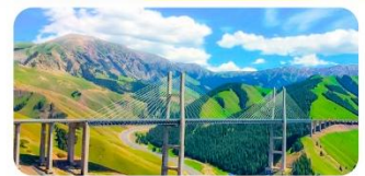
Cầu Quả Tử Cầu