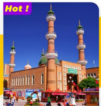
Hot ! Tham quan Chợ phiên Bazaar