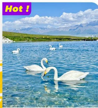
Hot ! Tham quan Hồ Sailimu