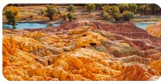
Vịnh Ngũ Sắc