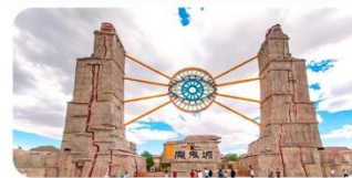
Thành phố ma Ô Nhĩ Hòa