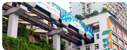
Ga tàu Lý Tử Bá