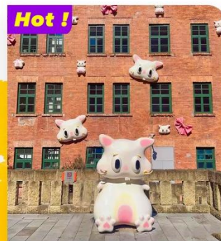
Hot! Chiêm ngưỡng Bức tường Meo meo - Hẻm Đới Gia