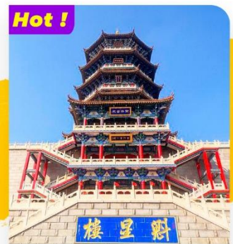
Hot! Tham quan Khôi Tinh Lâu Kuixing