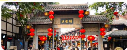
Ciqikou Old Town