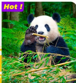
Hot! Tham quan Công viên gấu trúc