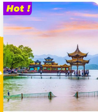
Khám phá Tây Hồ