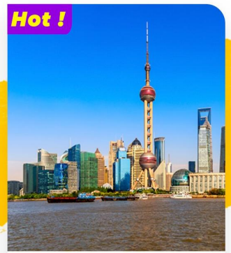
Tham quan Bến Thượng Hải