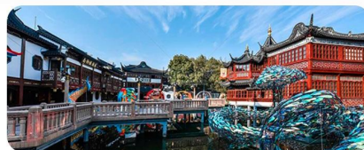
Miếu Thành Hoàng