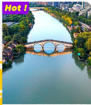
Tham quan Đại Vận Hà