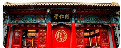
Đồng Nhân Đường