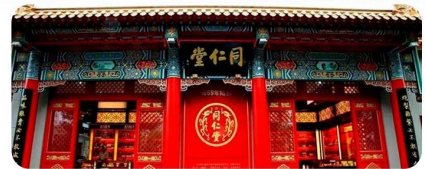
Đồng Nhân Đường