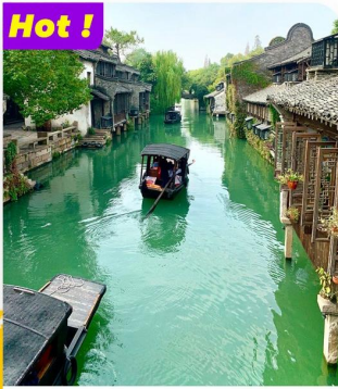
Khám phá Ô Trấn