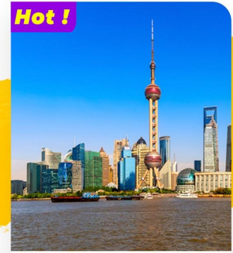
Tham quan Bến Thượng Hải