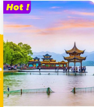
Khám phá Tây Hồ