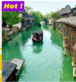
Tham quan Ô Trấn