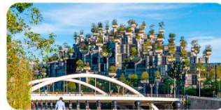
Thiên An Ngàn Thụ