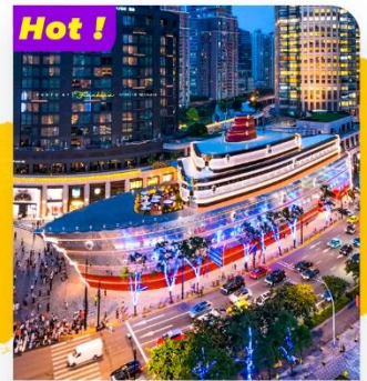
Check-in The Louis