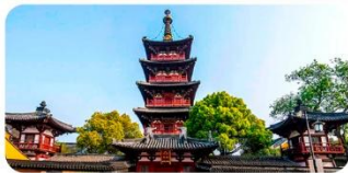
Hàn Sơn Tự