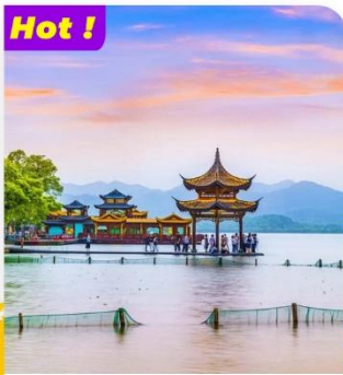
Khám phá Tây Hồ