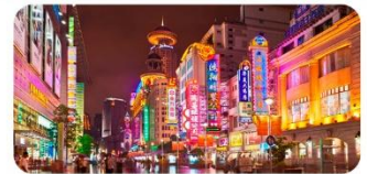
Phố đi bộ Nam Kinh