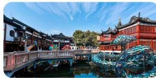
Miếu Thành Hoàng