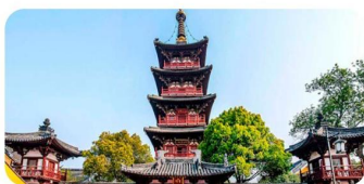
Hàn Sơn Tự