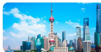
Tháp truyền hình Đông Phương Minh Châu