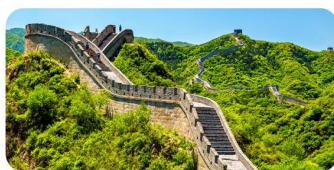
Vạn Lý Trường Thành