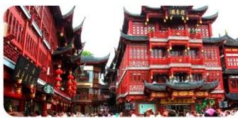
Miếu Thành Hoàng