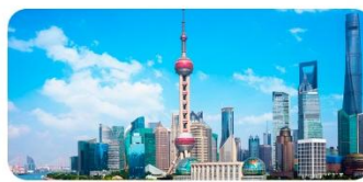
Tháp truyền hình Đông Phương Minh Châu