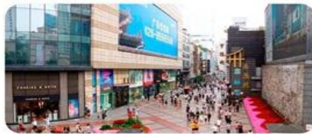
Phố Xuân Hy