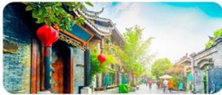
Ngõ Rộng - Ngõ Hẹp