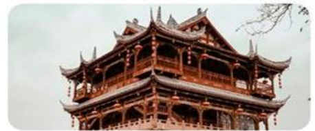
Cổ Trấn Lạc Đới