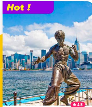
Khám phá Đại lộ Ngôi sao