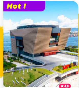
Chiêm ngưỡng Bảo tàng Cổ Cung