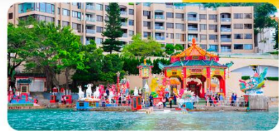
Vịnh nước cạn

NGÀY 1: TPHCM - HỒNG KÔNG - ĐẠI LỘ NGÔI SAO - KHU VĂN HÓA TÂY CỬU LONG