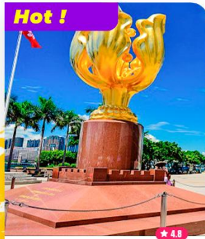
Tham quan Quảng Trường Dương Tử Kinh