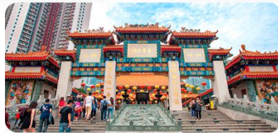
Miếu Huỳnh Đại Tiên