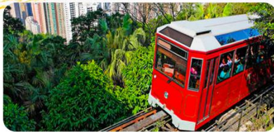
Đỉnh núi Thái Bình