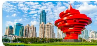
Quảng trường Ngũ Tứ