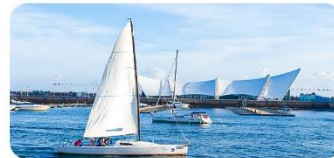
Trung tâm Thuyền Buồm Olympic