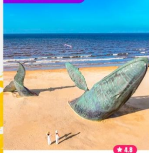
Tham quan Cá voi cô đơn