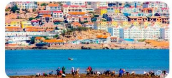
Bãi biển Sa Tử Khẩu