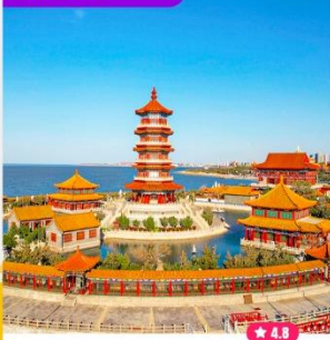
Tham quan Bát Tiên Quá Hải