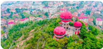
Núi Tín Hiệu