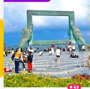
Tham quan Khung Ảnh Lớn Uy Hải