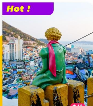
Khám phá Làng bích họa Gamcheon