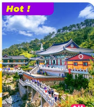
Tham quan Chùa Haedong Yonggungsa