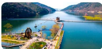
Công viên Songhae