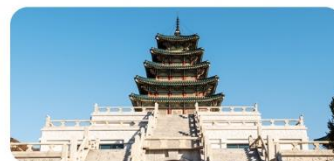
Viện bảo tàng truyền thống dân gian Quốc Gia