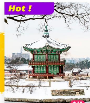
Tham quan Cảnh Phúc Cung