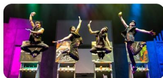
Hero Painter Show