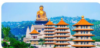
Phật Quang Sơn Tự