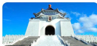
Nhà Tưởng niệm Tưởng Giới Thạch