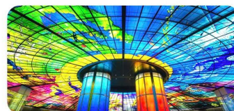
Trung tâm âm nhạc Cao Hùng