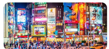
Chợ đêm Ximending